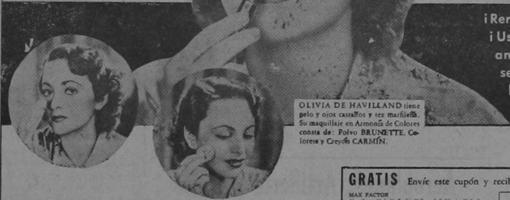
OLIVIA DE HAVILLAND tiene pelo y ojos castaños y tez marfileña. Su maquillaje en Armonía de Colores consta de: Polvo BRUNETTE, Colorete y Creyón CARMÍN.

Ahora, usted también puede participar del secreto de belleza de Hollywood y escoger su maquillaje como si FUERA una estrella! Max Factor le prescribirá personalmente, al igual que a Joan Crawford, Virginia Bruce, Ginger Rogers, Bárbara Stanwyck y otras estrellas, los tonos de Polvo, Colorete y Creyón propios de su tipo.